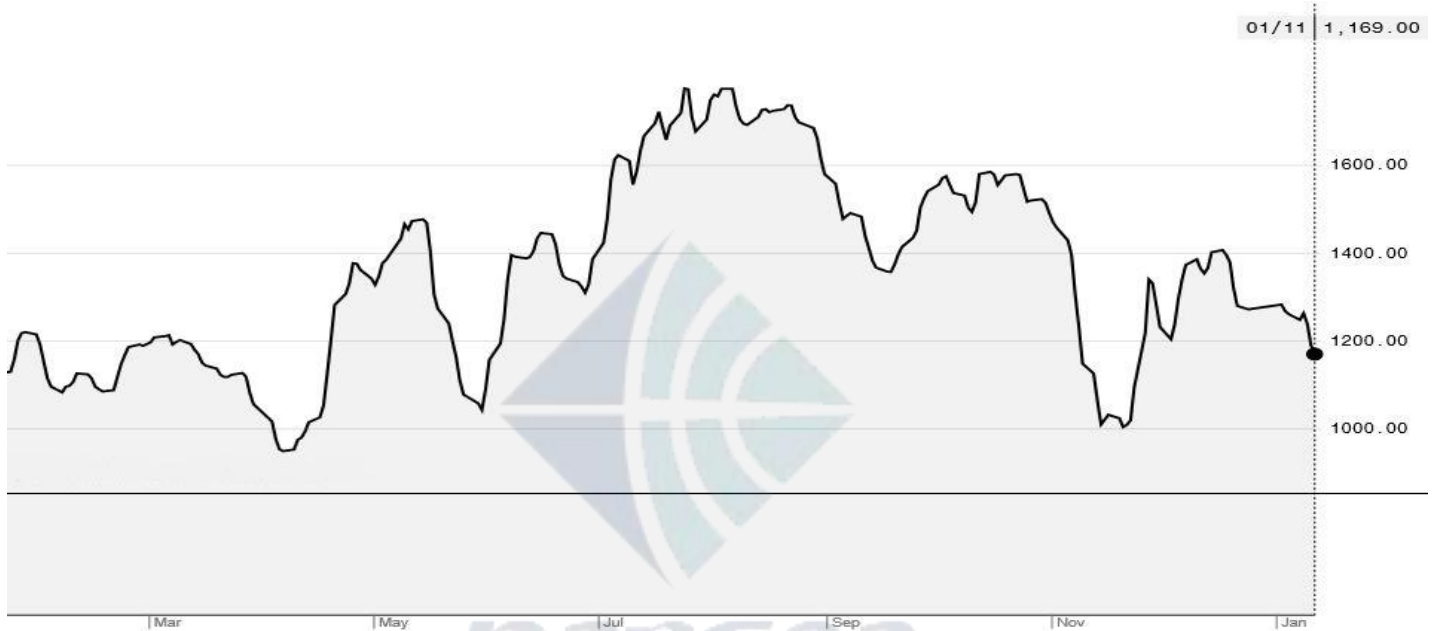
BDI-Dry Market Index (3/01/2018-1/11/2019)