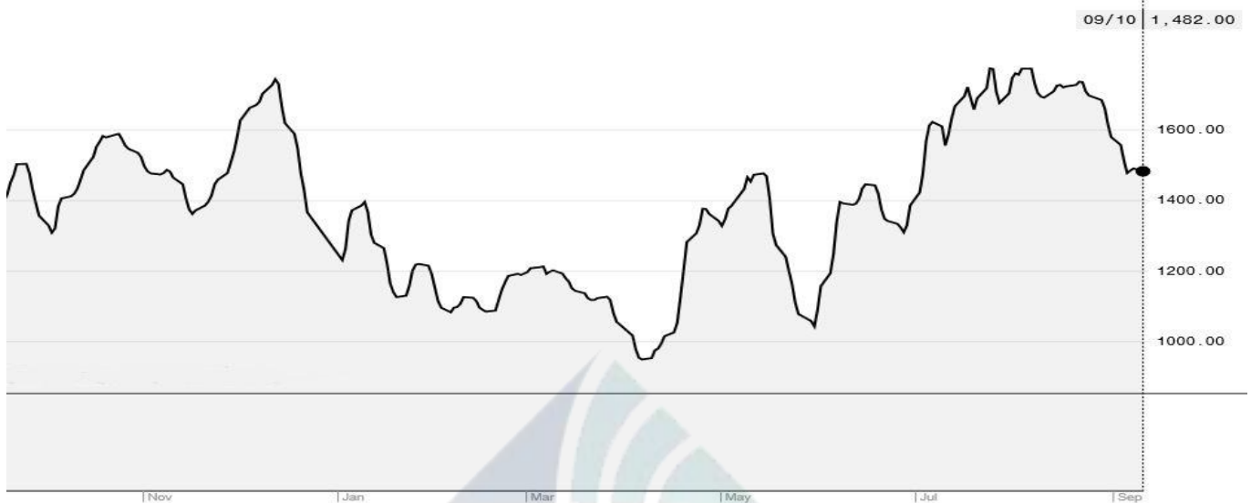
BDI-Dry Market Index (11/01/2017-09/10/2018)