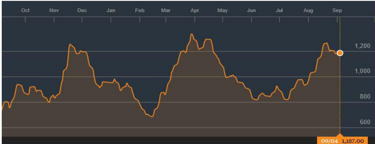
BDI-Dry Market Index (10/01/2016-09/04/2017)