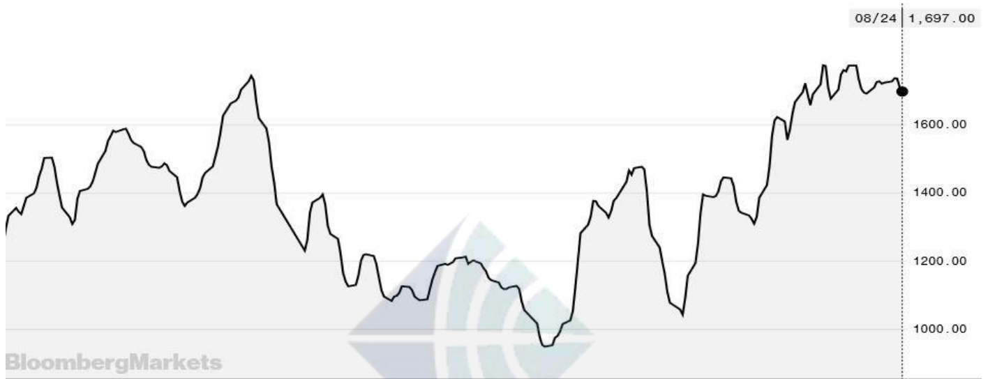
BDI-Dry Market Index (09/01/2017-08/24/2018)