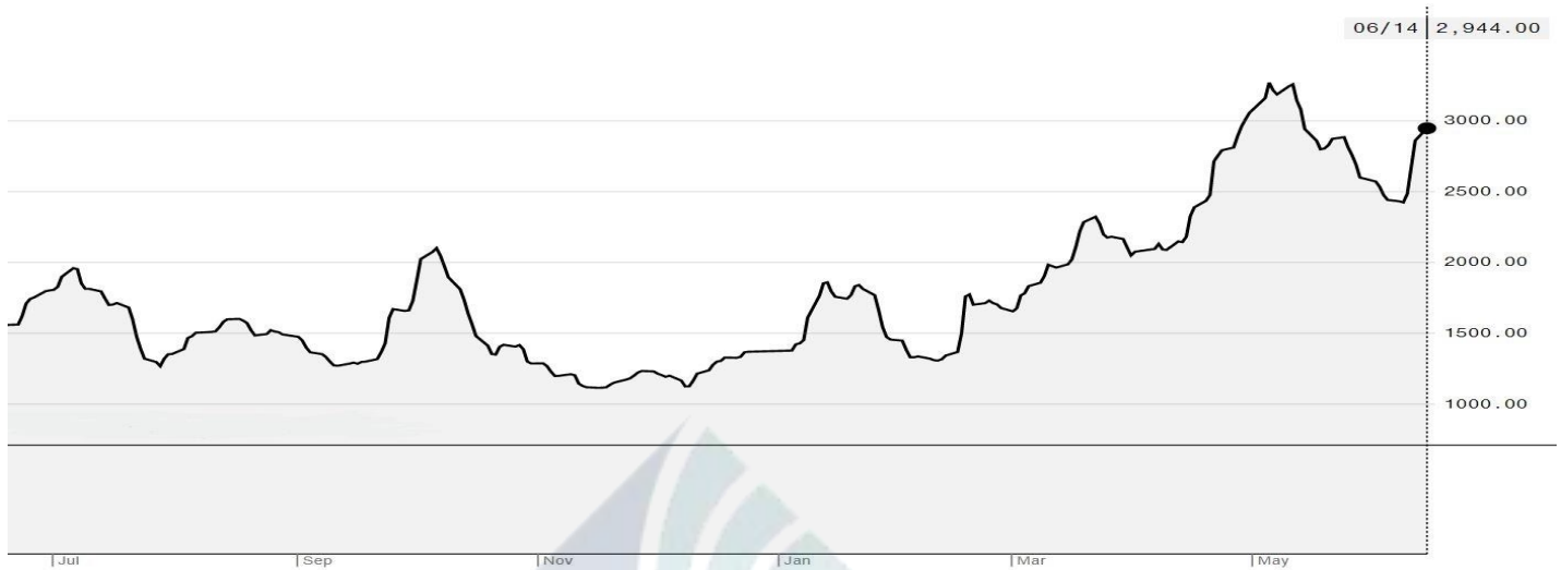
BDI-Dry Market Index (01/07/2020-14/06/2021)