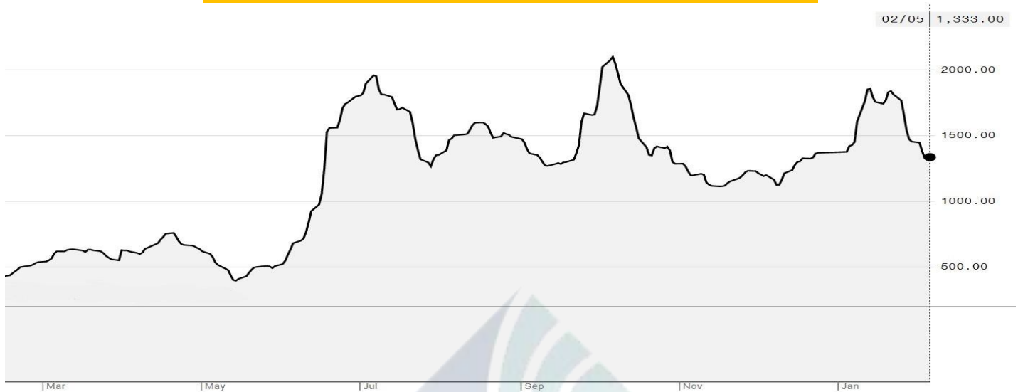
BDI-Dry Market Index (01/03/2021-05/02/2021)