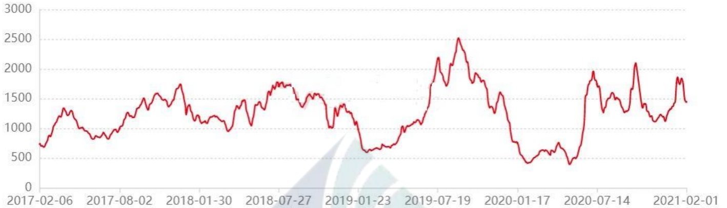
BDI-Dry Market Index (06/02/2017-01/02/2021)