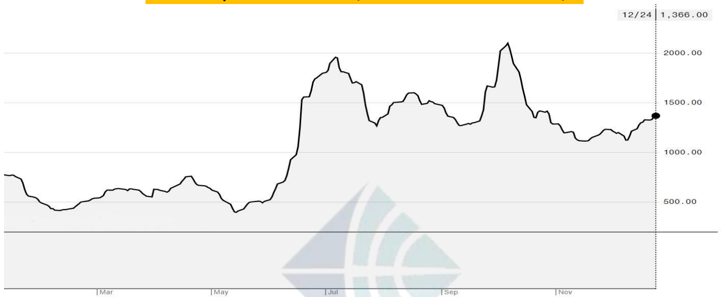
BDI-Dry Market Index (01/03/2020-24/12/2021)