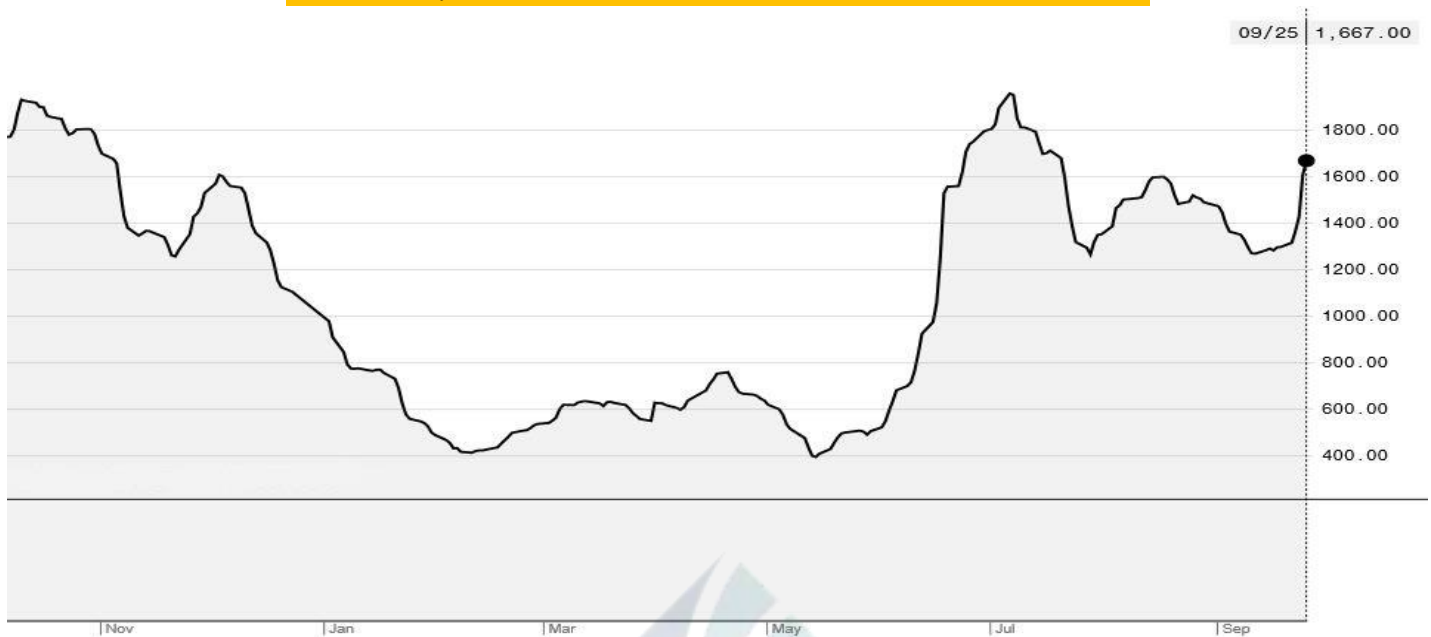
BDI-Dry Market Index (01/11/2019-25/09/2020)