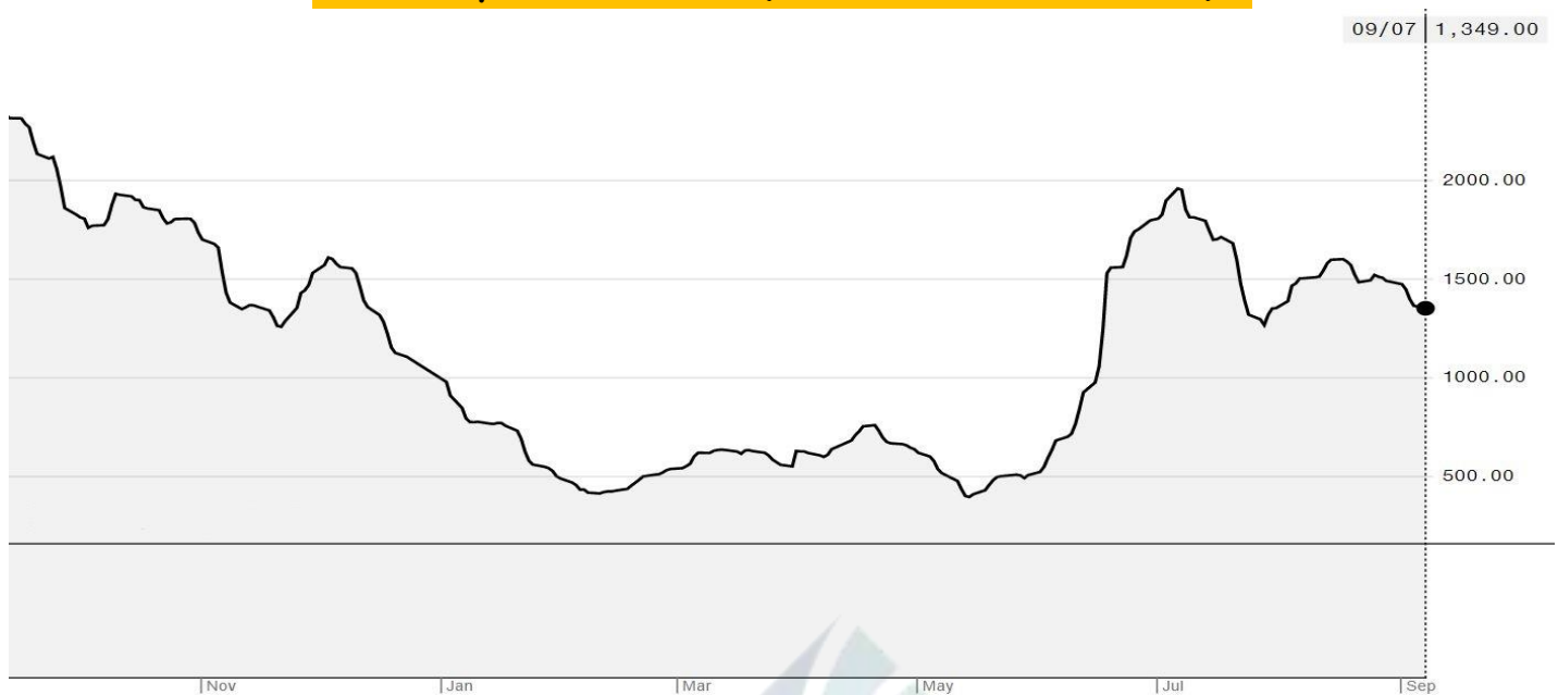
BDI-Dry Market Index (01/11/2019-07/09/2020)