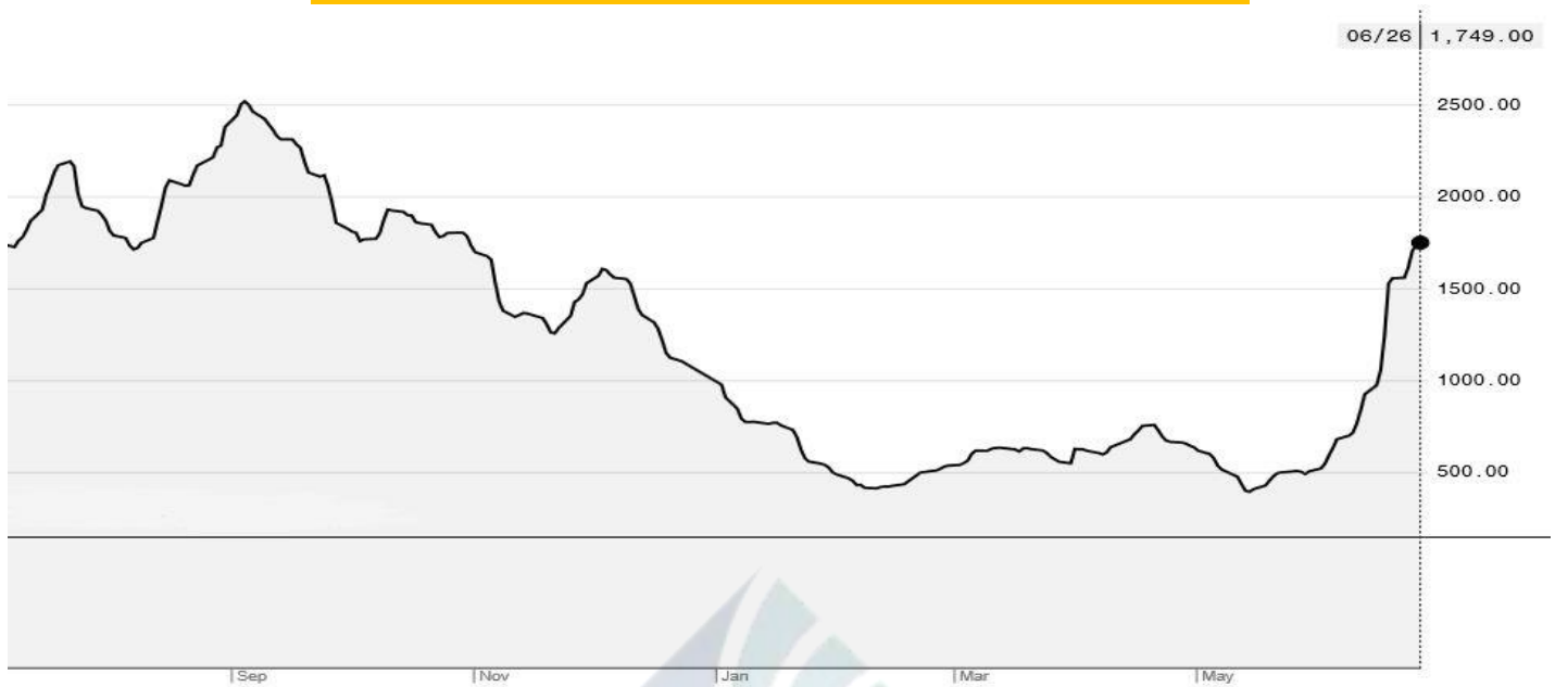
BDI-Dry Market Index (01/09/2019-29/06/2020)