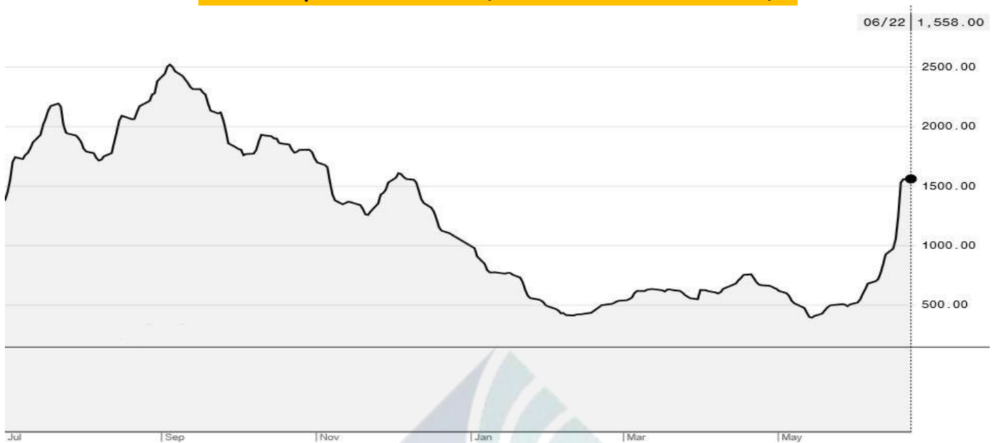
BDI-Dry Market Index (01/07/2019-22/06/2020)