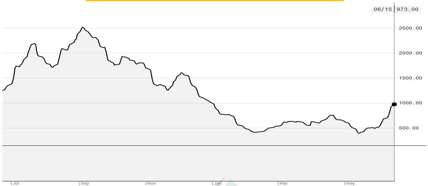
BDI-Dry Market Index (01/07/2019-15/06/2020)