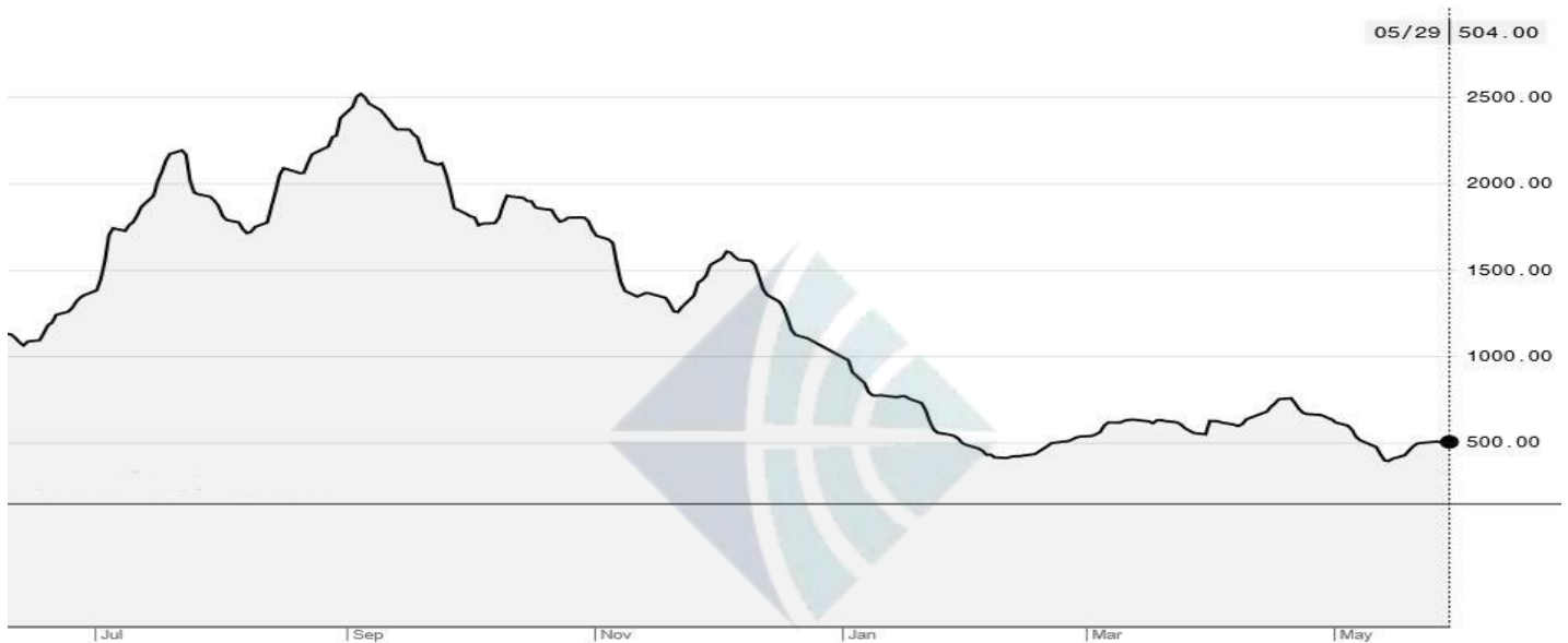
BDI-Dry Market Index (01/07/2019-29/05/2020)