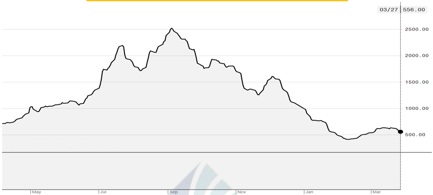
BDI-Dry Market Index (01/05/2019-27/03/2020)