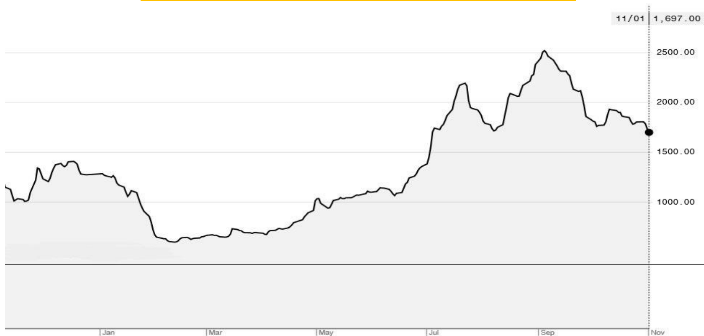
BDI-Dry Market Index (01/01/2019-11/01/2019)