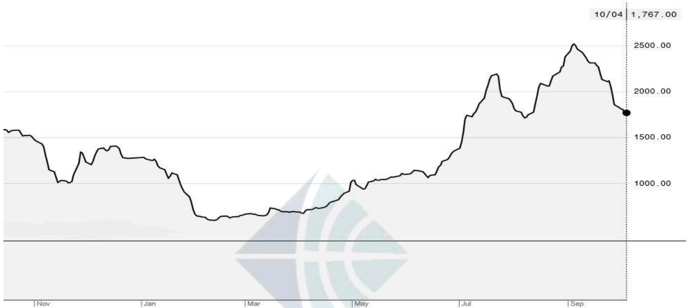
BDI-Dry Market Index (11/01/2018-10/04/2019)