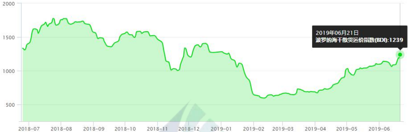
BDI-Dry Market Index (7/01/2018-6/21/2019)