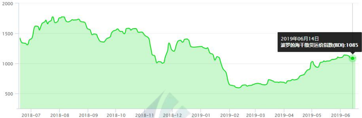
BDI-Dry Market Index (7/01/2018-6/14/2019)