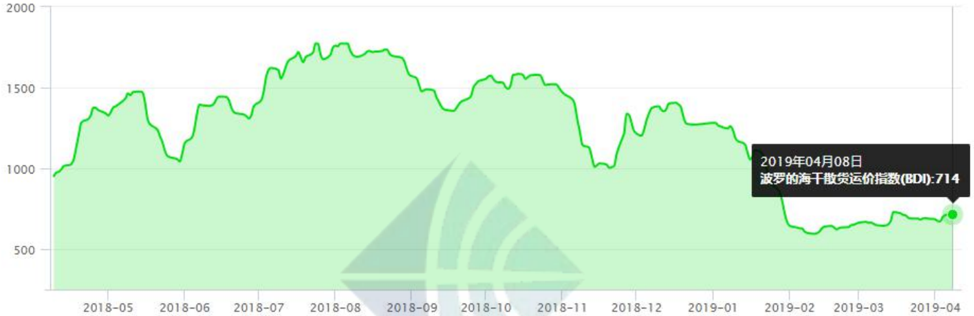
BDI-Dry Market Index (5/01/2018-4/08/2019)