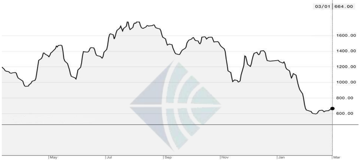
BDI-Dry Market Index (5/01/2018-3/01/2019)