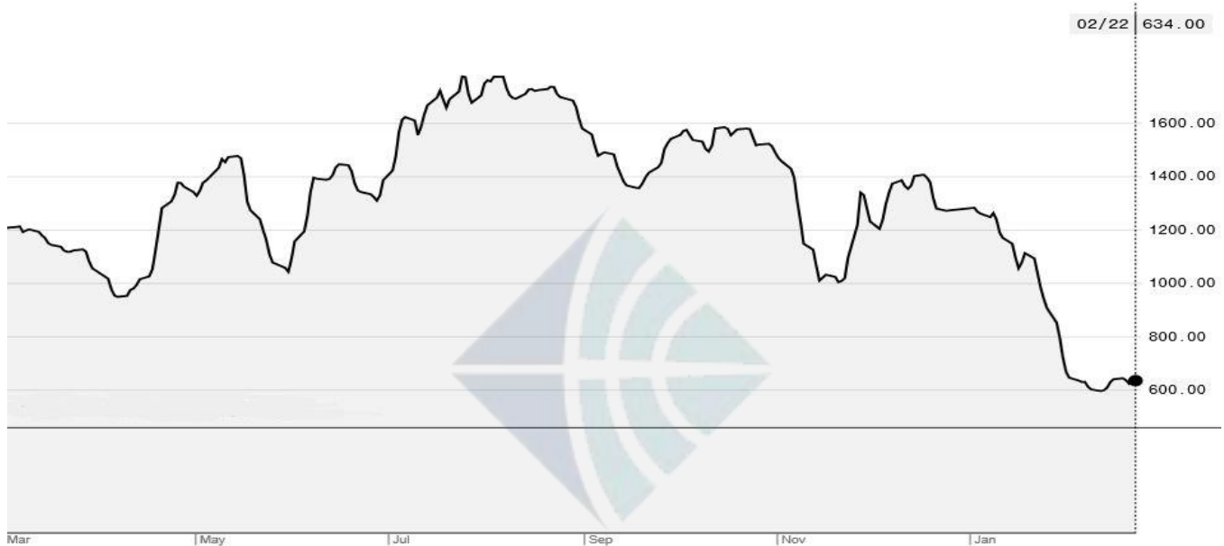
BDI-Dry Market Index (3/01/2018-2/22/2019)