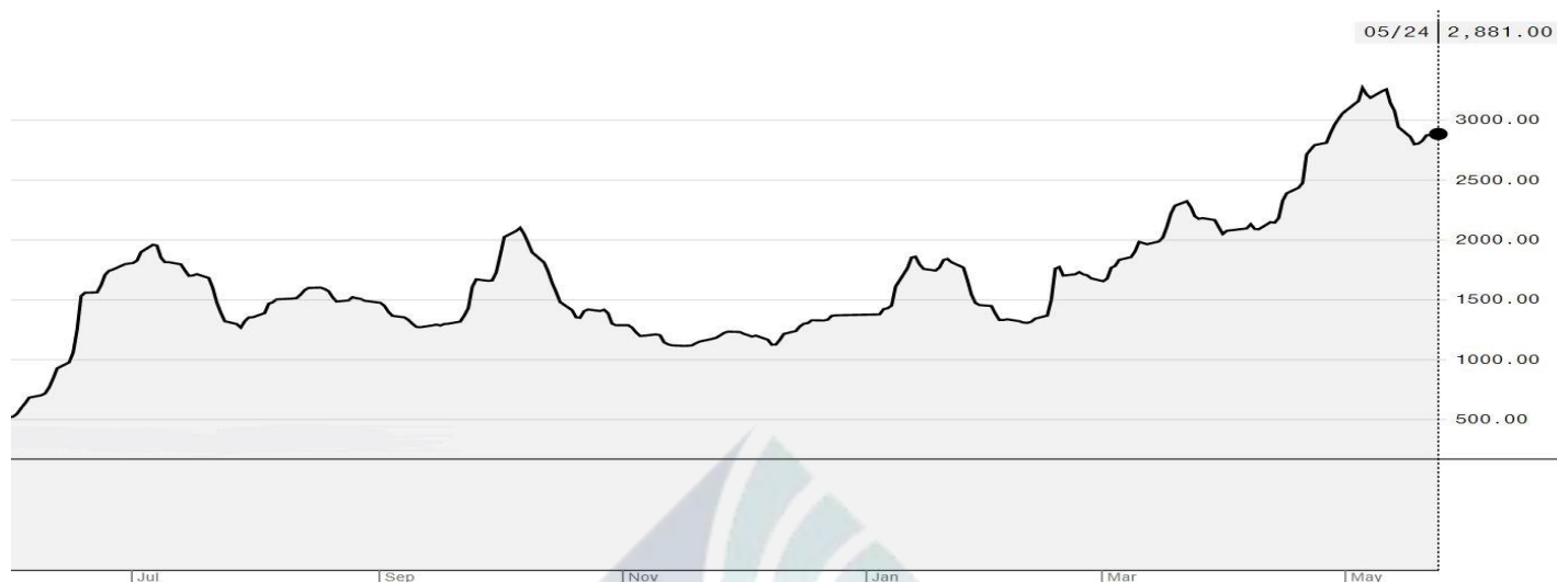
BDI-Dry Market Index (01/07/2020-24/05/2021)