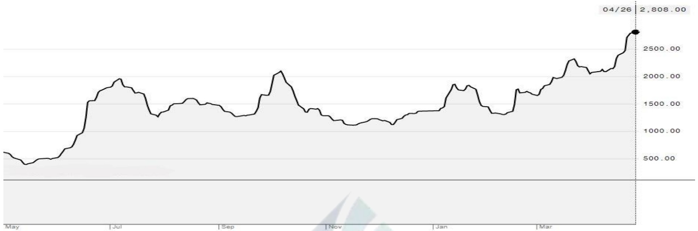
BDI-Dry Market Index (01/05/2020-26/04/2021)