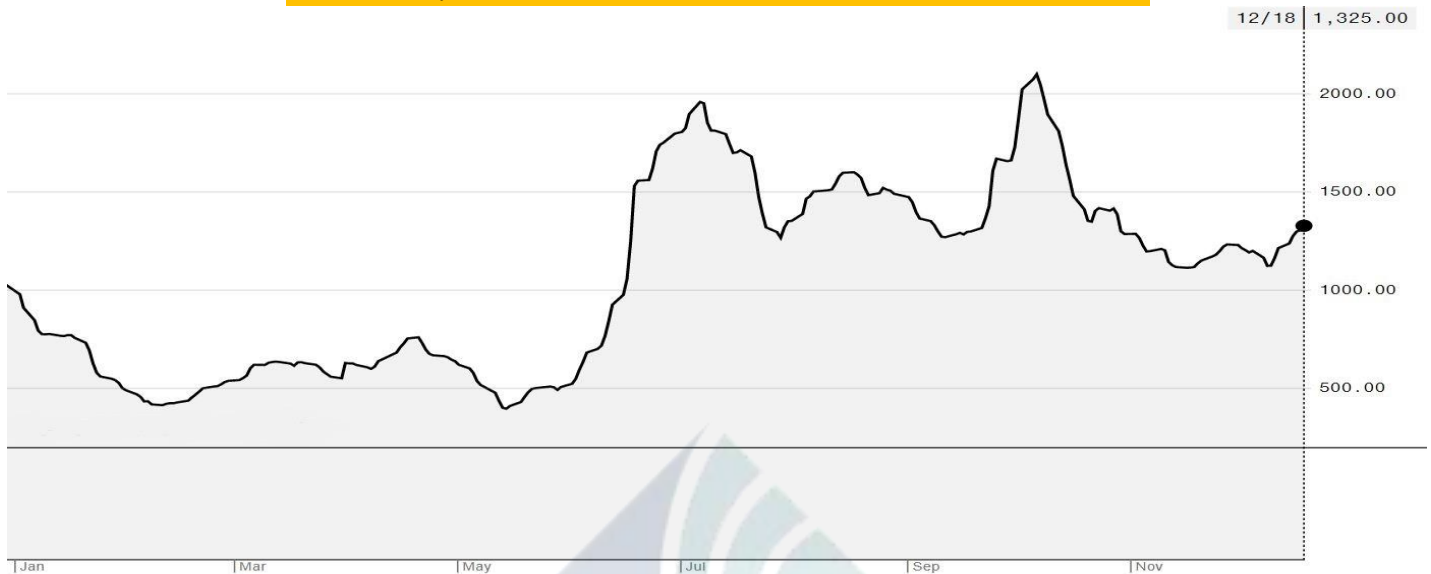
BDI-Dry Market Index (01/01/2020-18/12/2020)