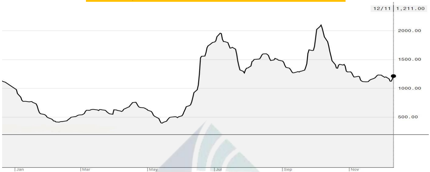
BDI-Dry Market Index (01/01/2020-11/12/2020)