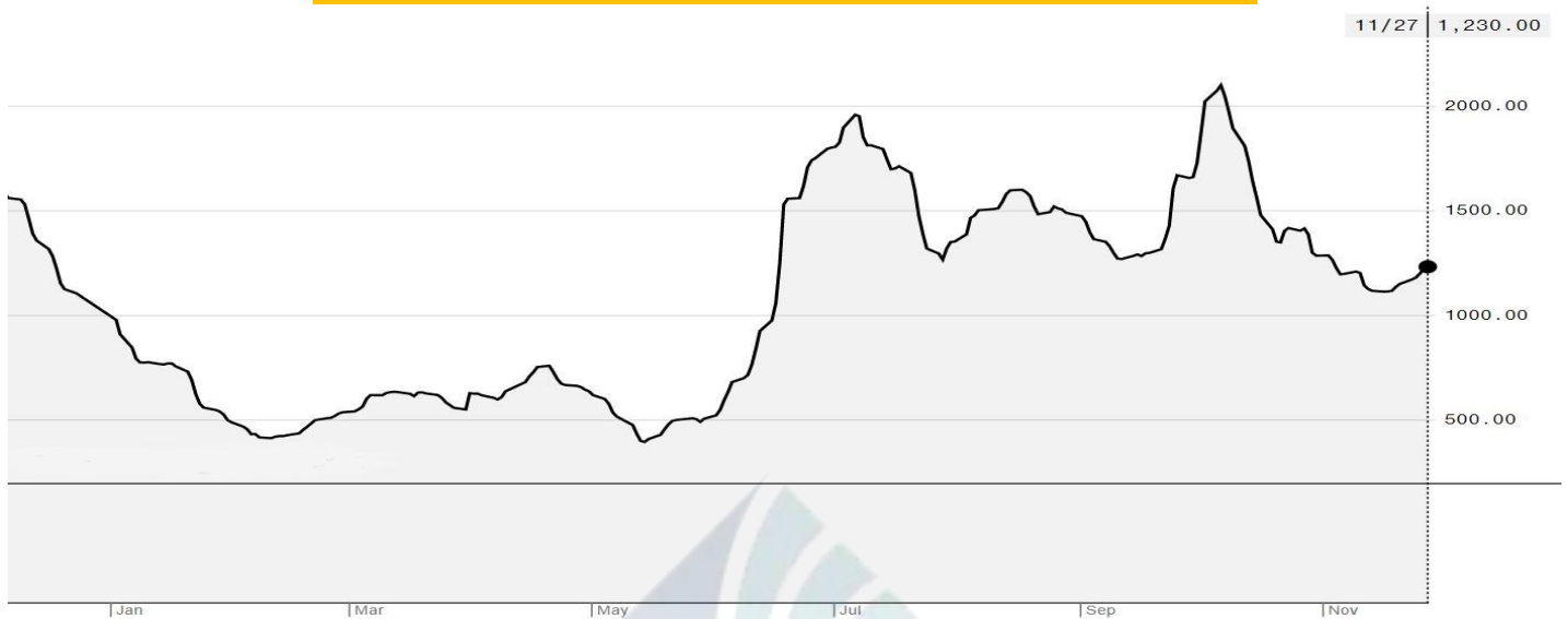
BDI-Dry Market Index (01/01/2020-27/11/2020)