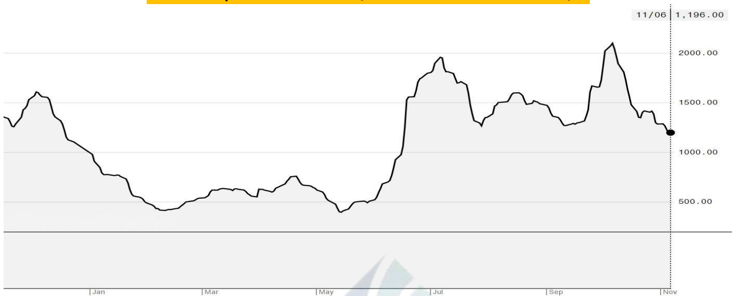
BDI-Dry Market Index (01/01/2019-06/11/2020)