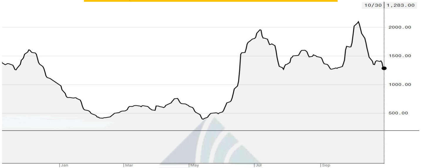
BDI-Dry Market Index (01/01/2019-30/10/2020)