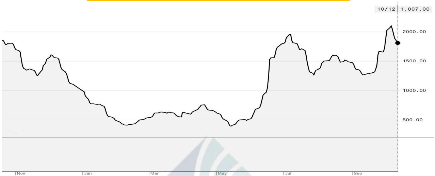
BDI-Dry Market Index (01/11/2019-12/10/2020)