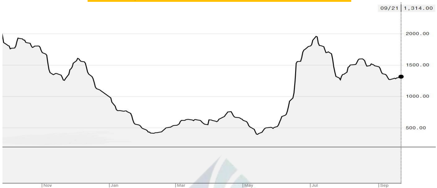
BDI-Dry Market Index (01/11/2019-21/09/2020)