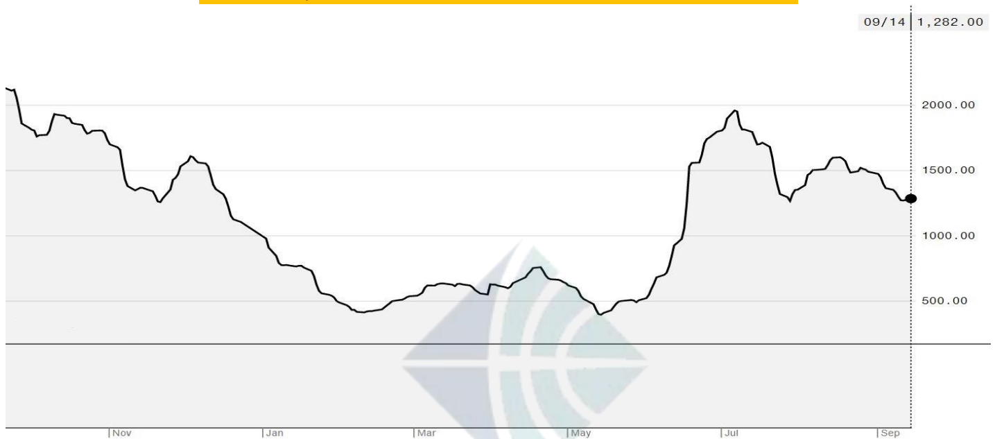
BDI-Dry Market Index (01/11/2019-14/09/2020)