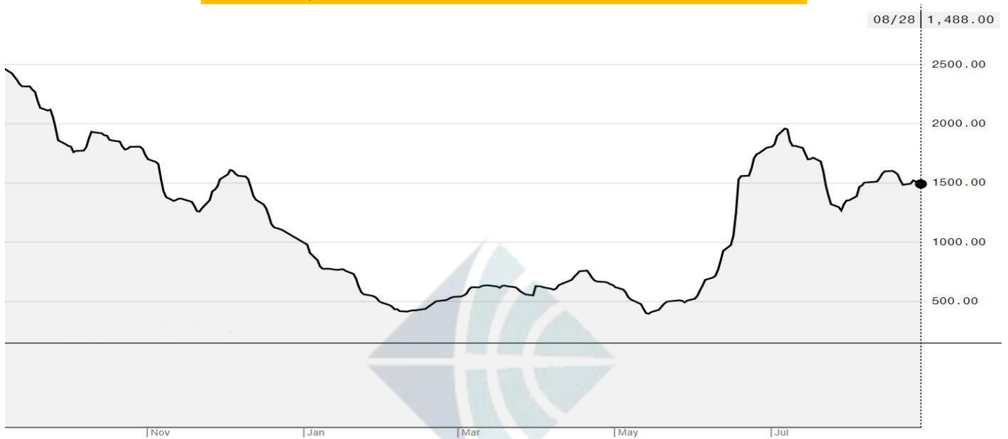
BDI-Dry Market Index (01/11/2019-28/08/2020)