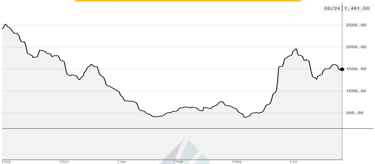
BDI-Dry Market Index (01/09/2019-24/08/2020)