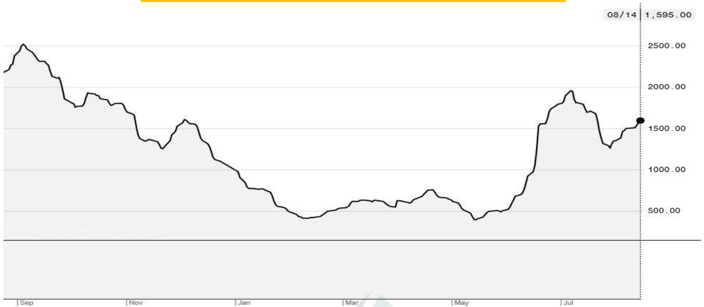
BDI-Dry Market Index (01/09/2019-14/08/2020)