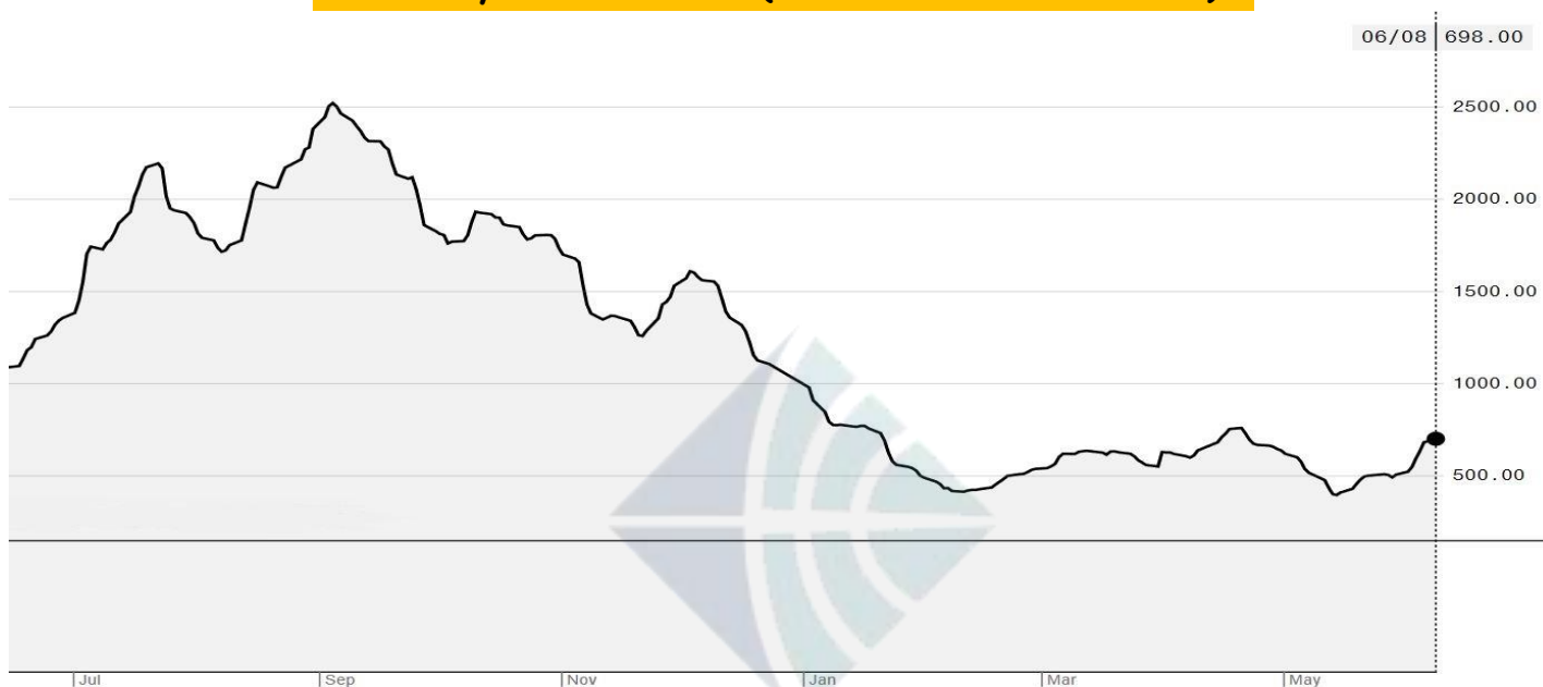
BDI-Dry Market Index (01/07/2019-08/06/2020)