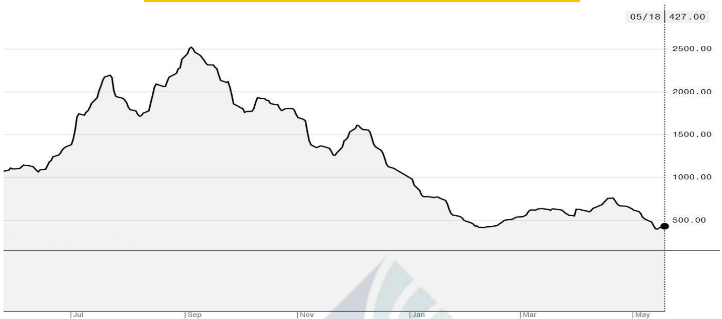
BDI-Dry Market Index (01/07/2019-18/05/2020)