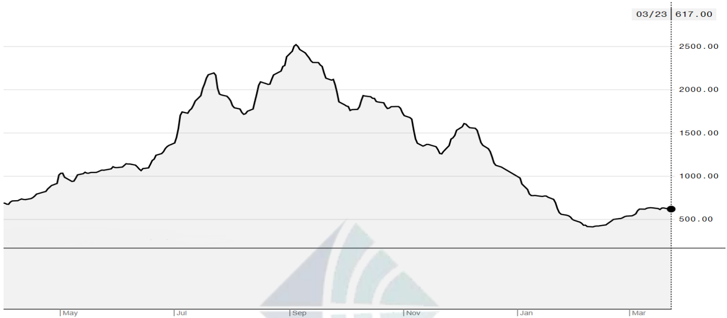
BDI-Dry Market Index (01/05/2019-23/03/2020)