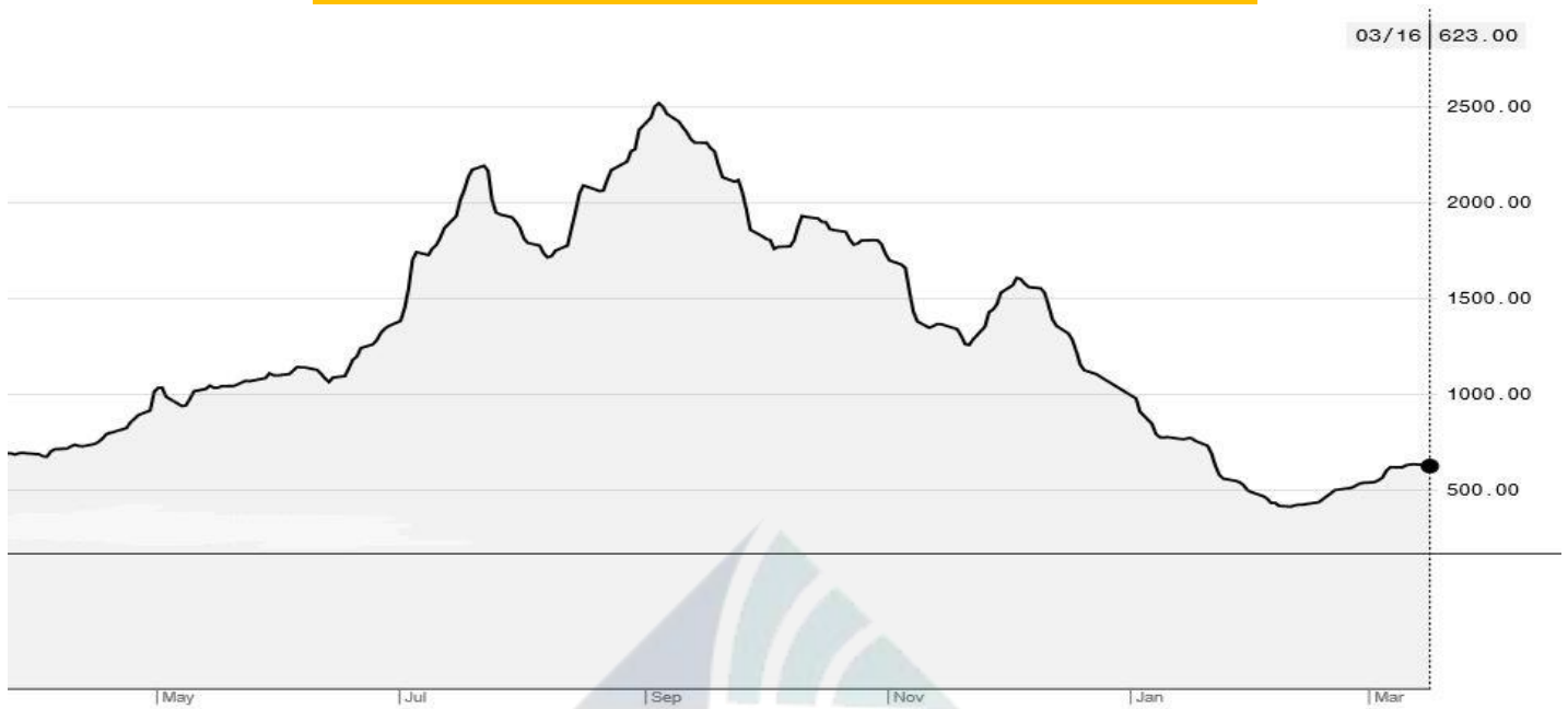
BDI-Dry Market Index (01/05/2019-16/03/2020)